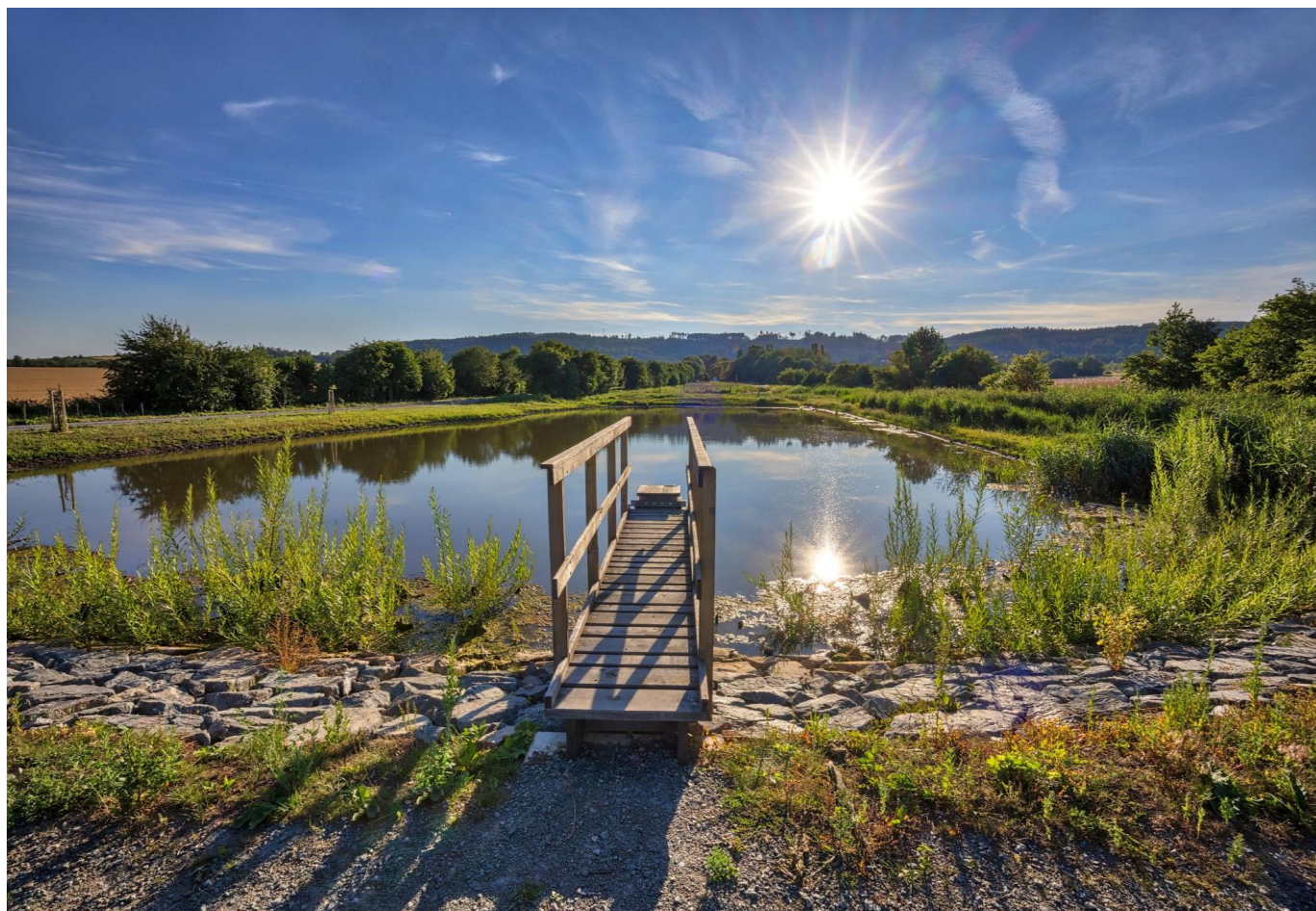
Borotín 2022 – nový rybník v biocentru